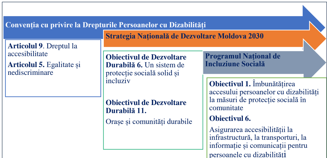
Figura 1. Cadrul Strategic de analiză