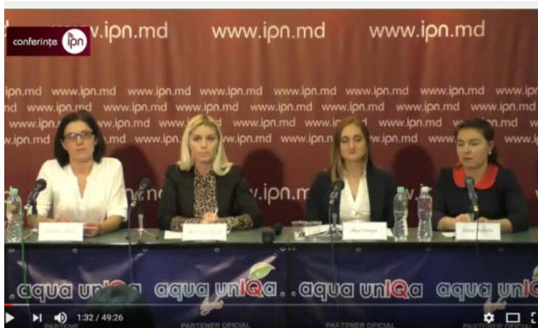
conferințe IPN | Clinica Juridică Universitară, Barierele și necesitățile meilor cu dizabilități