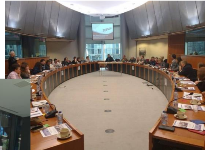
Parlamentul European Bruxelles, 2016