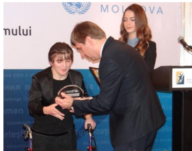
Premiul „Cel mai bun film auto-biografic”