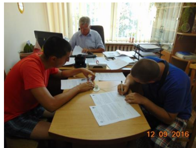
Amenajări Spații Verzi, Ungheni