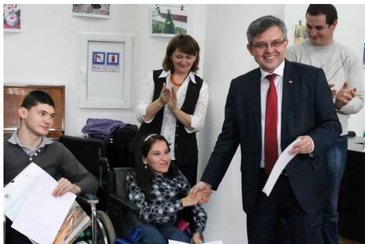
Ministrul Muncii, Protecției Sociale și Familiei