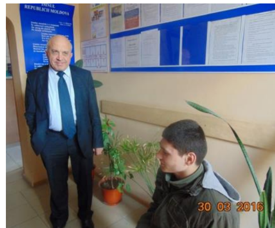
Direcția Asistență Socială și Protecție a Familiei, Ungheni