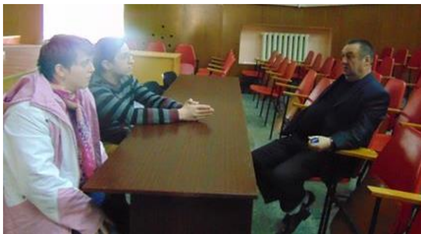
Secția Cultură și Turism, Consiliul Raional Fălești