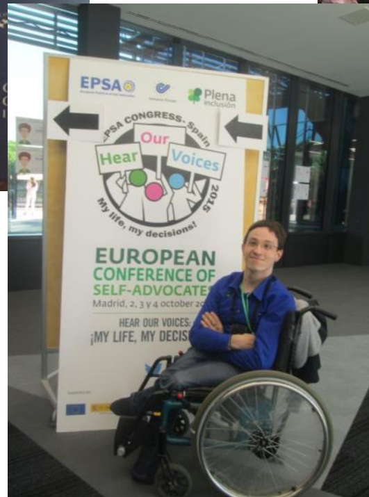
Conferința internațională a auto-reprezentanților, Madrid, 2015