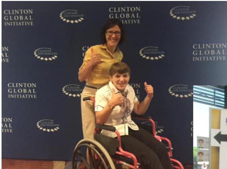
Clinton Global Initiative SUA, 2016